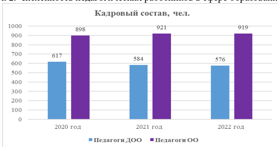
Рисунок 2. Численность педагогических работников в сфере образования

В 2022 году в дошкольных образовательных организациях работает 584 педагогических работника, из них – 465 воспитателей. В общеобразовательных организациях – 921 педагогический работник, из них 811 учителей.